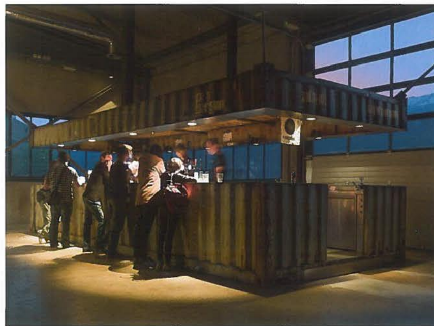
L'intérieur des conteneurs est complètement élaboré.

Texte: Marianne Kürsteiner