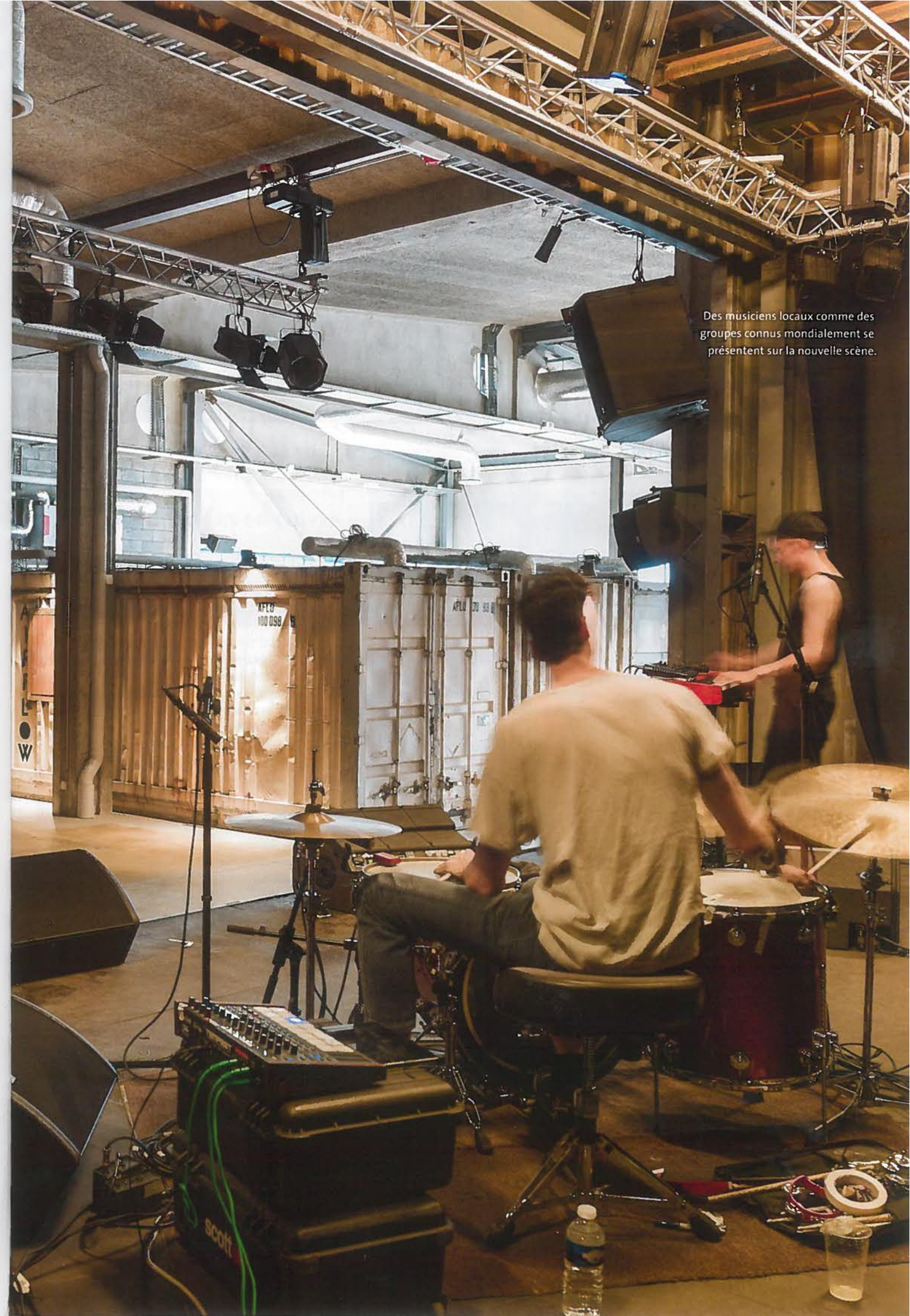
Des musiciens locaux comme des groupes connus mondialement se présentent sur la nouvelle scène.