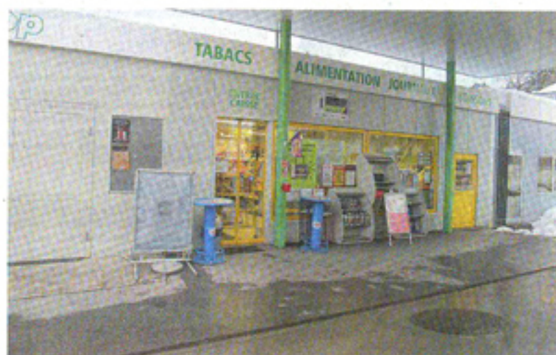
Les malfaiteurs ont pénétré dans le magasin en fracturant une vitrine.