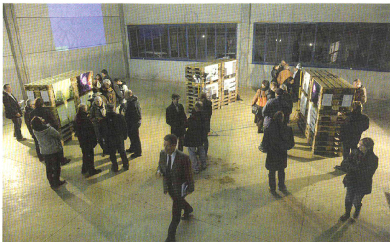
Cinq bureaux d'architecture ont concouru. Savioz et Fabrizio s'imposent, devant Bonnard et Woeffray de Monthey. Berclaz & Torrent occupent la troisième place, tandis que DV architectes et Walliser Architekten terminent respectivement aux 4e et 5e places.

Quatre containers seront placés sous forme de «totem» près