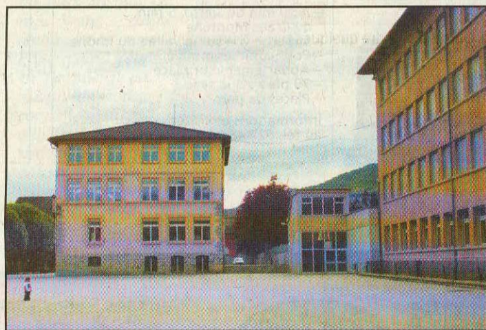
Le centre scolaire de Borzuat aujourd'hui. Au centre, l'école allemande qui sera démolie et à droite l'école de La Barre.

A l'évidence ces bâtiments ne correspondent plus aux normes actuelles. Dès lors, la Ville a dressé un plan directeur des écoles sierroises, validé en 2006. Celui-ci répartit géographiquement les populations scolaires sur son territoire. La Municipalité a optimisé l'utilisation des différents complexes et planifié dans le temps et dans l'espace les futures réalisations ainsi que les assainissements des constructions existantes. Borzuat figure parmi les priorités de ce plan. Le présent concours a été mis sur pied en collaboration avec les services cantonaux des bâtiments et de l'enseignement. «Son but est de répondre aux besoins de l'ins-