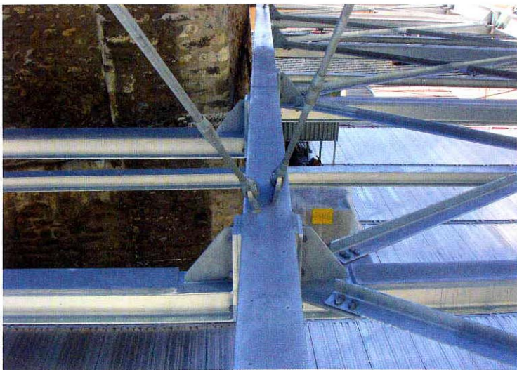
Fig. 4 : Platelage de travail suspendu aux sommiers principaux